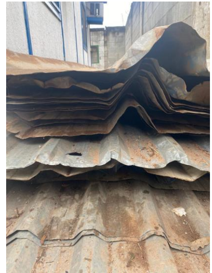
Fotos 1 a 3 – Vista das telhas disponibilizadas em área pertencente à PMSP

Irregularidade 5.8. A previsão de quantidades absolutamente dissociadas da realidade fática do local das obras, bem como a maneira que se deu o aditamento desses quantitativos, caracteriza falha grosseira de projeto e da condução da fiscalização contratual. (subitem 3.12)